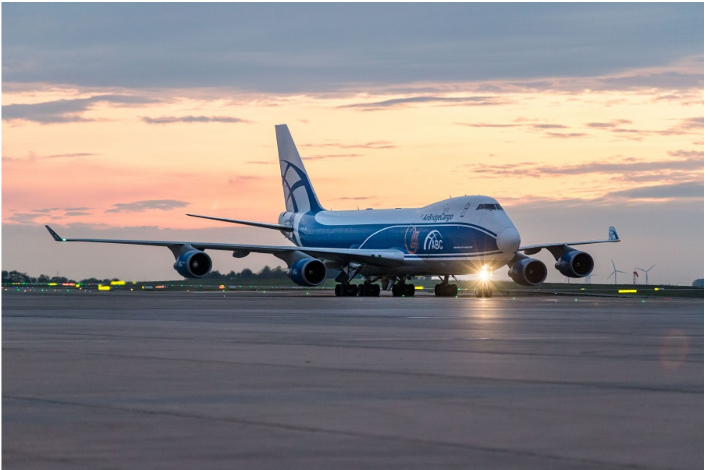
ABC открыла рейсы в Льеж