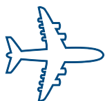
Современный флот Боинг 747

Для получения более детальной информации, пожалуйста, свяжитесь со службой персонала авиакомпании по номеру + 7 977 9715299