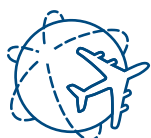
Интересная география полетов