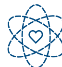
Страхование от несчастного случая